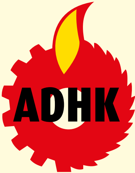
Avrupa Demokratik Haklar Konfederasyonu