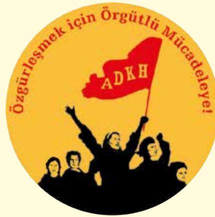
Avrupa Demokratik Kadın Hareketi