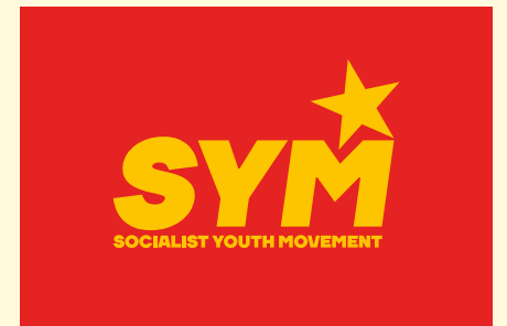
Socialist Youth Movement